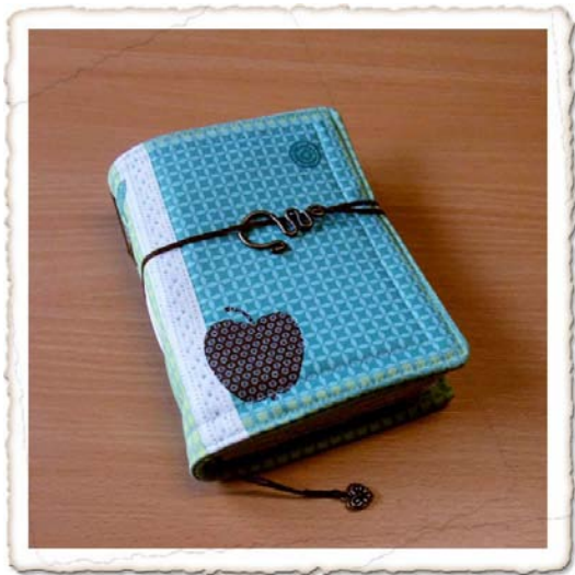
Abbildung 2: Das Gewinnerbuch von Michaela Müller designt, Renate Ikinge verarbeitet und der Stoff- Schmie.de gedruckt

Das 120 g/m 2 schwere Papier schmiegt sich unliniert und mit Acrylfarben gefärbt 216 mal vorder- und rückseitig aneinander. Ein Eldorado für kreative Ideen, verrückte Gedanken, wilde Skizzen und spannende Notizen.