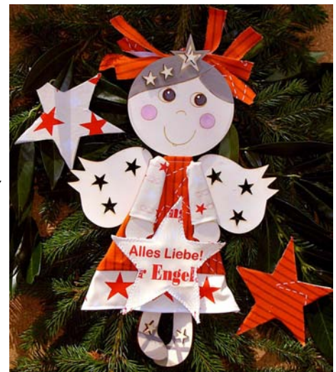
Abbildung 3: Engel designt und bekleidet von Martina Hertel; Stoff gedruckt bei www.Stoff-Schmie.de

Ob zu Weihnachten oder zwischendurch - zum selber Basteln sollte er sein. DAS GARTENHAUS in Person von Martina Hertel hatte bereits selber eine kleine Engel-Parade kreiert und freute sich nun auf Gleichgesinnte, die Lust hatten zu nähen, kleben und basteln. Was gibt es Schöneres, als selbstgemachte Engel den Liebsten zu schenken. Die textile Gestaltung war wieder ganz in Eigenkreation. "Unser Dekorationsvorschlag: Der Engel hängt am liebsten als Willkommensgruß an Deiner Haustür. Befestige ihn mit Draht an selbst gesammelten Grün."